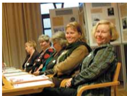
Gäster från Emma i Vilhelmina samt VågaVåga i Sölvesborg