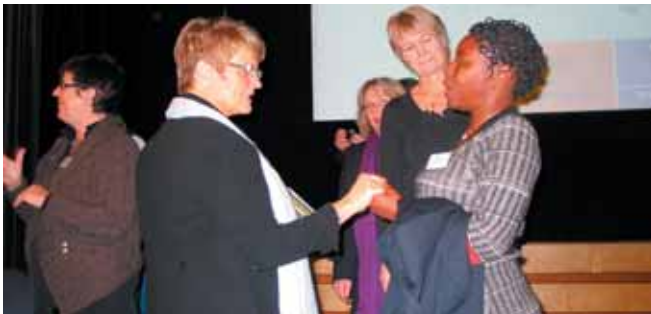
Många möten både på och nedanför scenen

– Det krävs en nationell strategi för att stödja kvinnorna. Och vi måste ta fram statistik för att visa omvärlden hur verkligheten ser ut, sa hon.