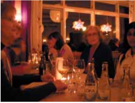
Kvällens stämningsfulla middag