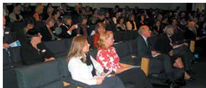
... en välbesökt konferens

Text och bilder Solveig Cappelen Christina – föreningen för företagsamma kvinnor