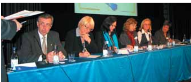
Panelens röster ...

Hela eftermiddagen jobbade deltagarna med frågor kring "Hur kan WinnetEuropa och regionala aktörer samarbeta